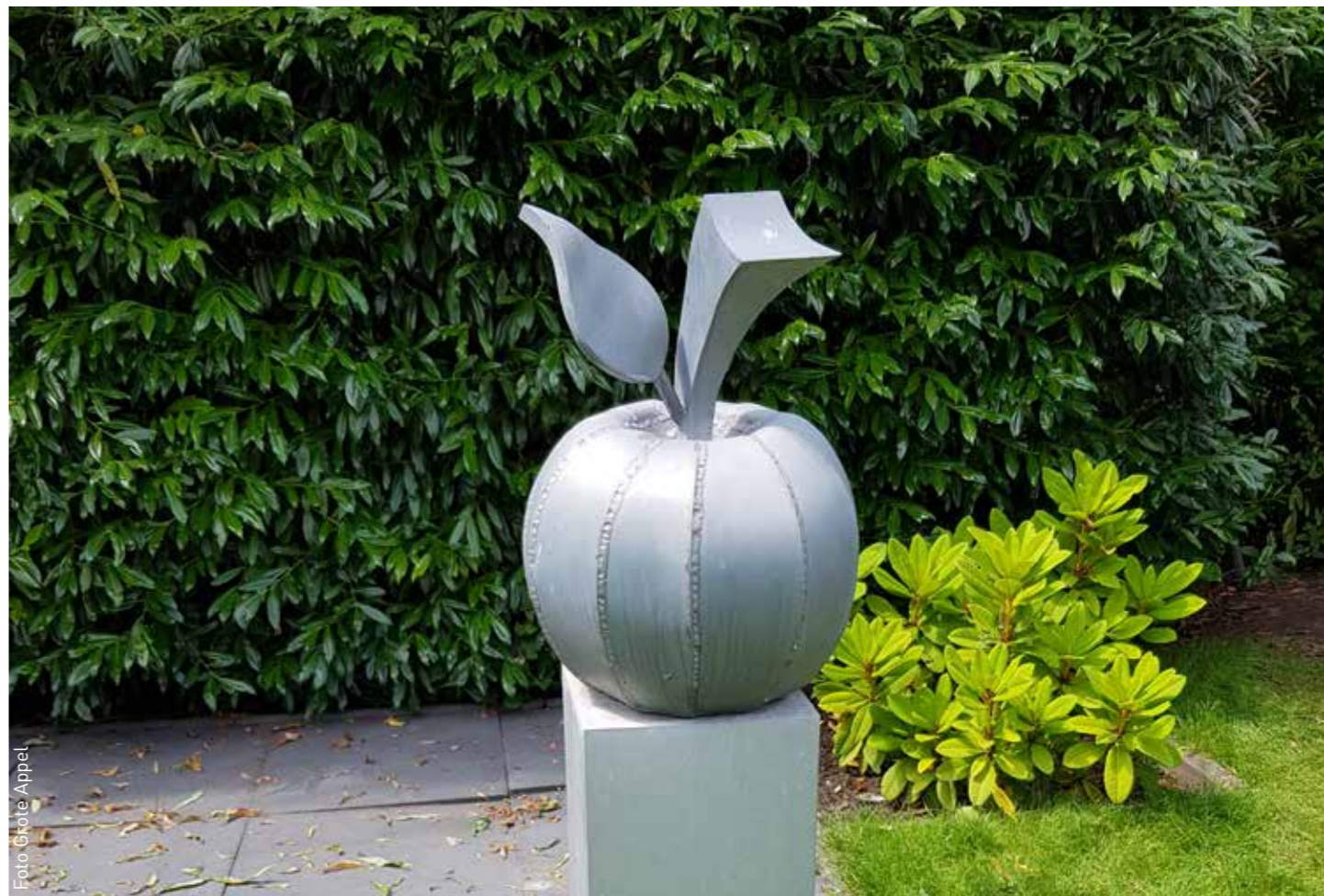
Foto Grote Appel